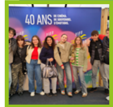
GT Art d'Expression

Cinéma, théâtre et créativité en action : nos élèves ont fait leur show ! Une journée pleine d'émotions, de découvertes... et de scénarios dignes d'Hollywood ! De l'intelligence artificielle aux acrobaties poétiques, ils ont tout exploré. L'option Arts d'expression ? Toujours là où ça bouge !