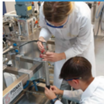
TT Sciences appliquées

Les options Sciences et Sciences appliquées ont vécu des journées exceptionnelles : les Physics Project Days à Louvain-la-Neuve et une immersion au Centre de Technologies Avancées ! Des découvertes scientifiques, des expériences interactives et immersives et des rencontres inspirantes avec le monde de la recherche et de la technologie ... Un régal pour la curiosité de nos élèves.