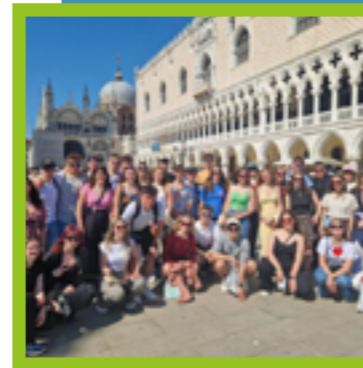
Rhétos Transition et Qualifiant

Les élèves de 4e GT & TT ont vécu une journée de découverte à Louvain , alliant visite guidée en langues, nature et exploration de la ville. Cette sortie a favorisé l'autonomie, l'ouverture culturelle et l'apprentissage concret en dehors de la classe. À l'ISPP Florennes, ces expériences enrichissantes participent à la formation de jeunes curieux et prêts pour l'avenir.